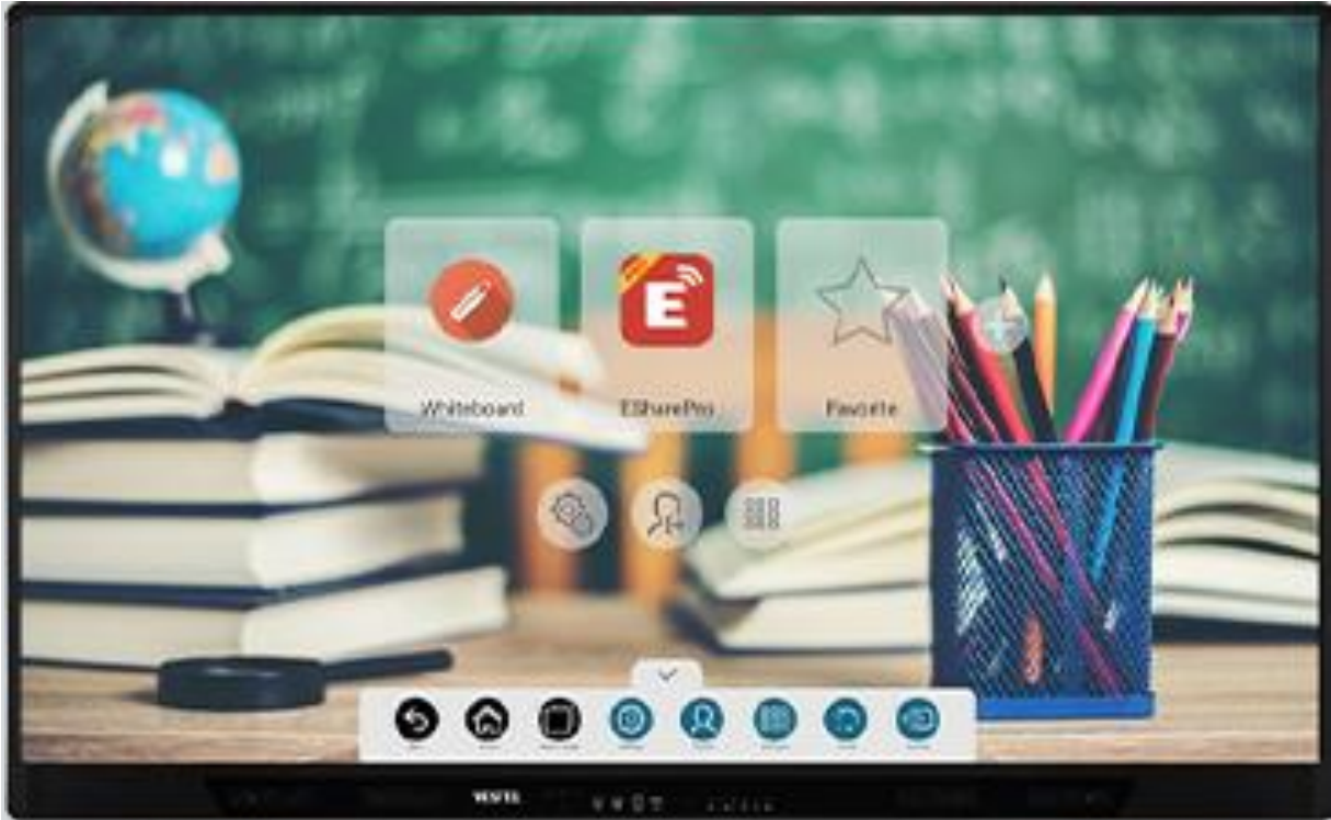
65-75-85" IFX sorozatú interaktív síkképernyős kijelzők